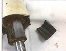
マグネット割れによる稼働停止